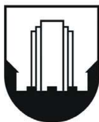
MESTNA OBČINA VELENJE

Grb se lahko pojavi tudi kot trirazsežnostni predmet. Kot izhodišče velja enobarvna različica v dveh variantah, kjer temne oz. svetle površine ponazarjajo dvignjene oz. spuščene površine: