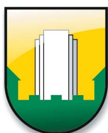
MESTNA OBČINA VELENJE

Z razvojem grafičnega oblikovanja, novimi tehnološkimi rešitvami, nepredvidenimi rabami ipd. se pojavljajo tudi grafične rešitve kot so prosojnost, navidezne 3D predstavitve grba, odbleski v podlagi, v podtonu dokumentov predstavljeni grbi, slepi tisk ipd., ki lahko s strokovnim pristopom prepričljivo aktualizirajo pojavnost in indentiteto občine. Te grafične rešitve se dovoljene zgolj, kadar gre za profesionalno spremembo pojavnosti grba, ki ga za vsako posamezno rešitev odobri avtor grba oz. župan.