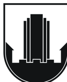
MESTNA OBČINA VELENJE