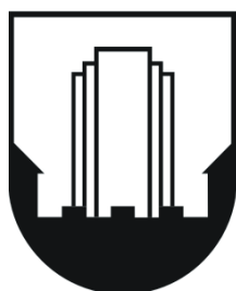
MESTNA OBČINA VELENJE