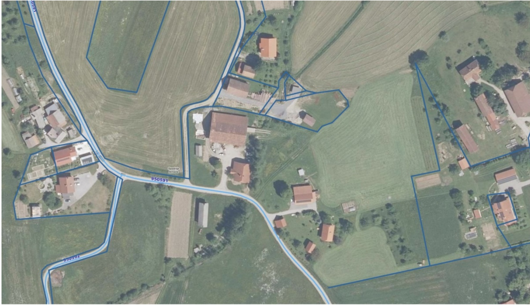
[slika 8] Prikaz cestnega omrežja