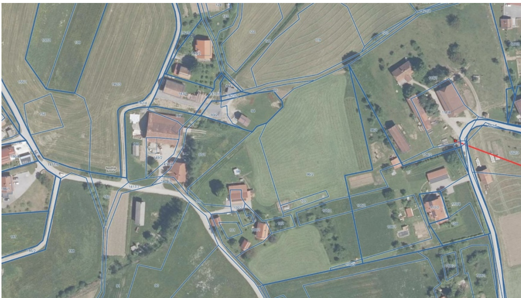
[slika 5] Prikaz energetskega omrežja – elektro vod