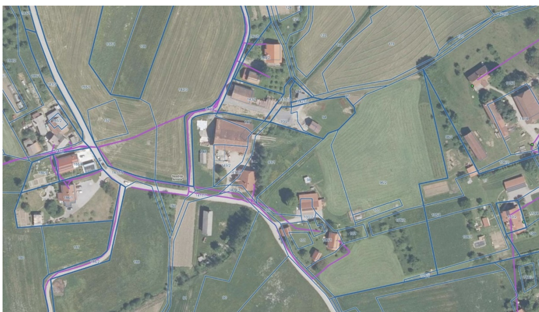
[slika 7] Prikaz TK omrežja