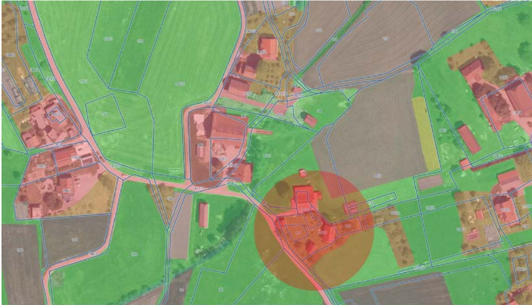
[slika 4] Grafični prikaz dejanske rabe zemljišča