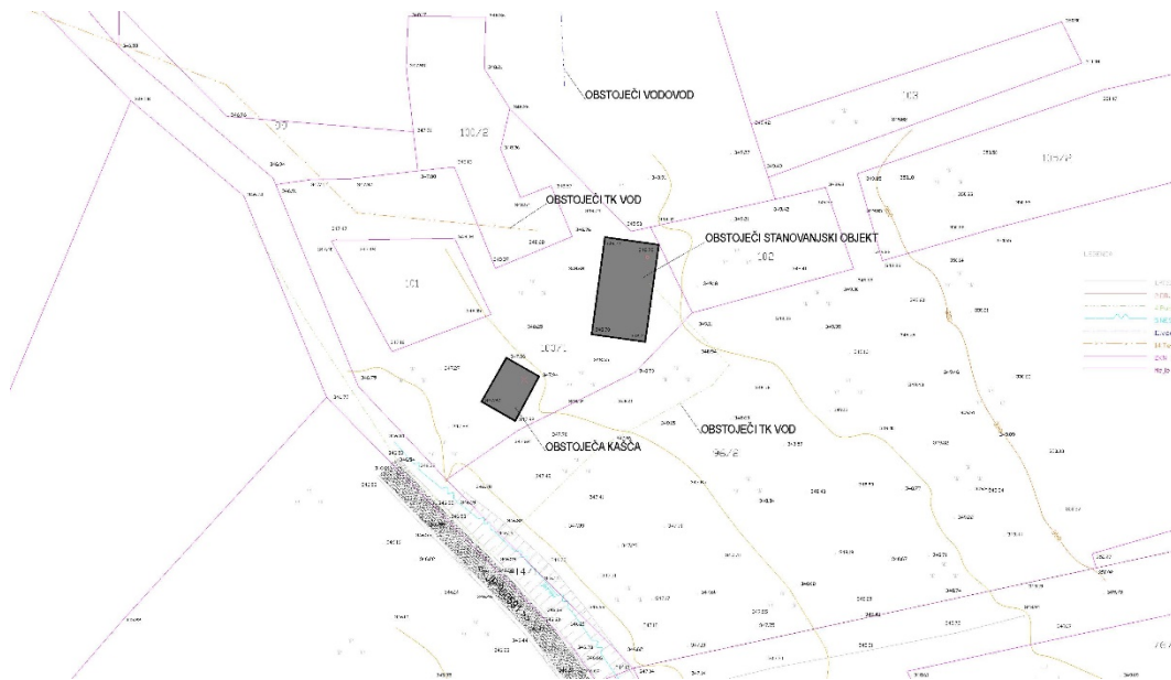
[slika 9] Geodetski načrt – prikaz dejanskega stanja