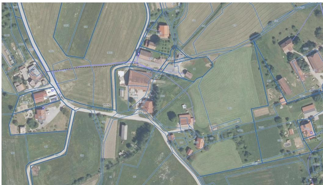
[slika 6] Prikaz vodovodnega omrežja