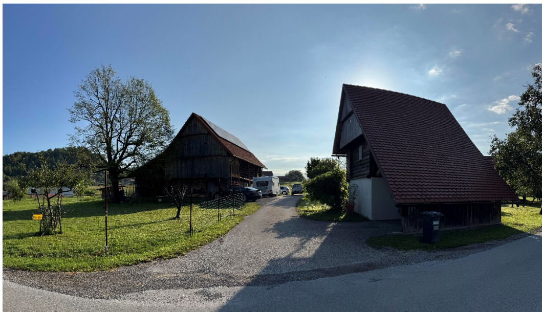
[slika 10] Prikaz dejanskega stanja – pogled na obstoječo dovozno cesto – dostop na obravnavano območje – pogled iz zahodne strani