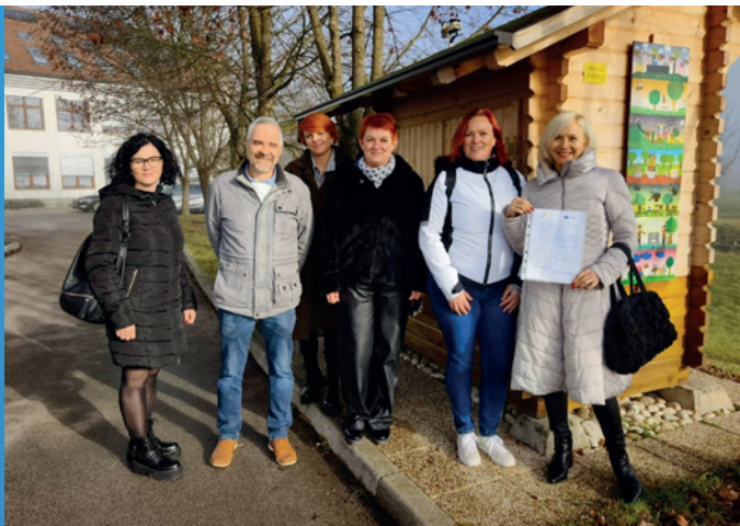
Podpis memoranduma o sodelovanju s OŠ Nazarje

Od 7. do 11. julija 2025 je v Perniku in Sofiji potekala poletna šola projekta BeeLieve, namenjena izmenjavi znanja in praktičnih izkušenj. Program je vključeval delavnice o krioprezervaciji čebeljega semena, umetni oploditvi matic, čebelarjenju v Bolgariji ter testiranju čebelarске opreme.