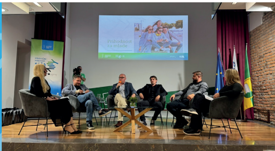
Okrogla miza Šaleška dolina na razpotju

odločitvami uspeli na nekoliko drugačnih poteh. Teme so prepletale vprašanja energetskega prehoda, skrbi za čisto in varno okolje, gospodarskega prestrukturiranja in družbenih vprašanj.