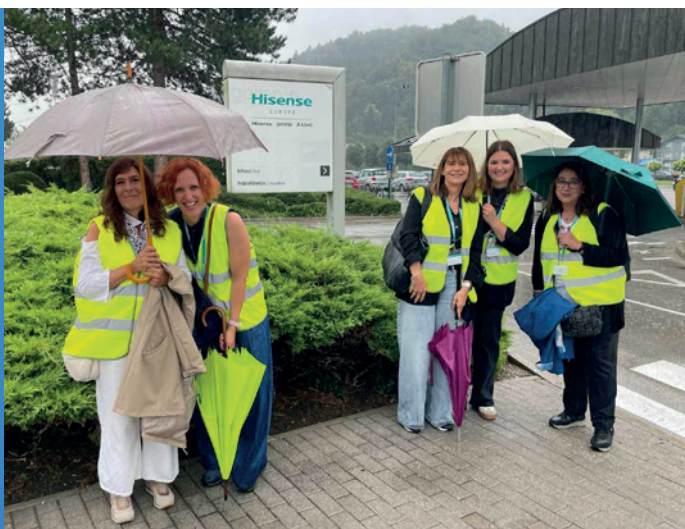
Mednarodna izmenjavo osebja v SAŠA regiji