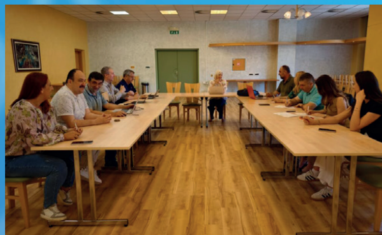
Sestanek projektnega upravnega odbora, Topolšica