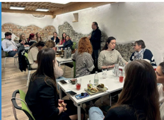
Podjetniško usposabljanje z izmenjavo dobrih praks