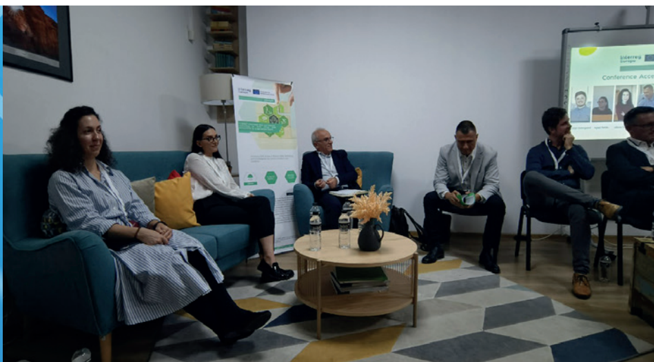
Konferenca Dostop do financ v Stari Zagori, Bolgarija