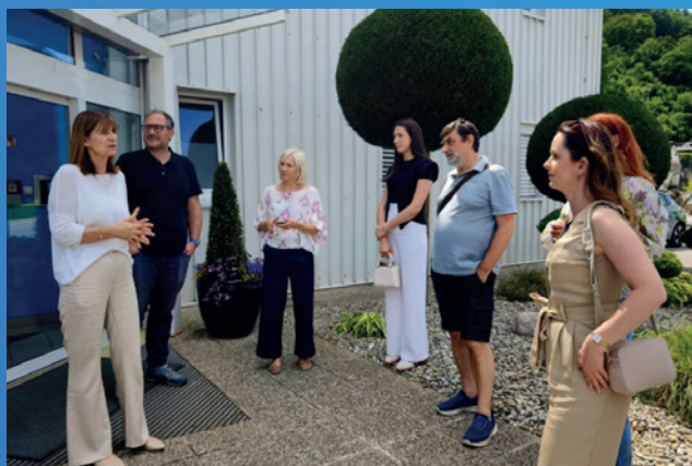
Obisk čistilne naprave, KP Velenje