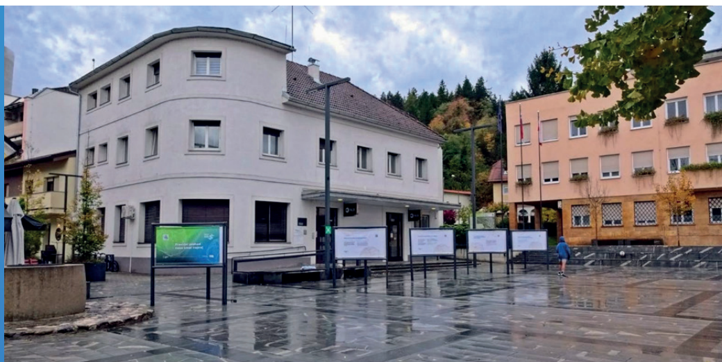
Razstava na prostem v Šoštanju

Informiranje in obveščanje smo izvajali skladno s komunikacijskim načrtom in strategijo CPP, hkrati pa se odzivali na aktualne dogodke in potrebe. Poleg ustaljenih kanalov obveščanja (spletna stran, družbena omrežja, sporočila za javnost, članki v tiskanih medijih, izjave za radio, gostovanja na televiziji, obveščanje preko kanalov partnerskih organizacij idr.) smo uvedli tudi nove: podkast, novičnik, razstava na prostem (Velenje in Šoštanj), video zasloni v občinah ožjega območja (Velenje, Šoštanj in Šmartno ob Paki). Objavili smo 6 podkastov, kjer smo predstavili navdihujoče posameznike iz regije, ki so s svojimi življenjskimi