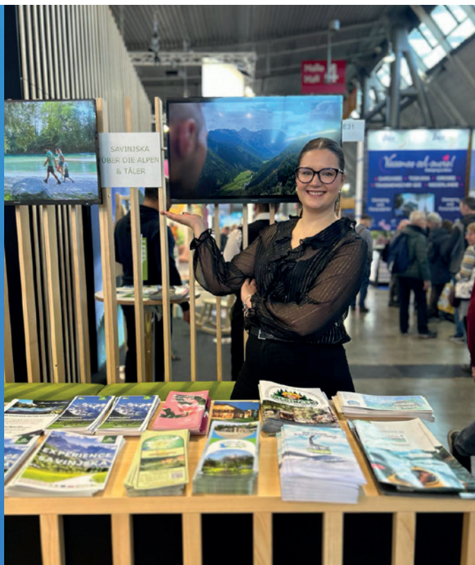
Sejem Stuttgart in München