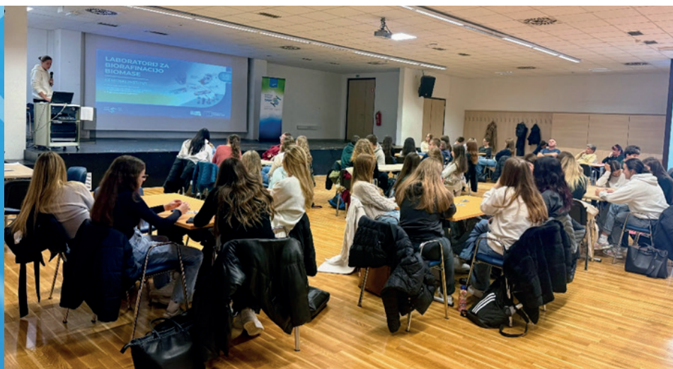
Delavnica s srednješolci

Informiranje mladih je zajemalo različne dogodke: najmlajše smo naslavljali preko Pikinega festivala (predfestivalne aktivnosti na temo poklicne prihodnosti otrok »Kaj boš pa ti, ko boš velik?« in delavnica na festivalu). Za srednješolce smo pripravili delavnice z naslovom »Pravični prehod – ka mam pa js s tem?«, študente smo nagovorili s hackatonom. Sodelovali smo na javni razpravi v organizaciji Mladinskega centra Velenje, Festivala Kunigunda: »A vemo kam gremo?«.