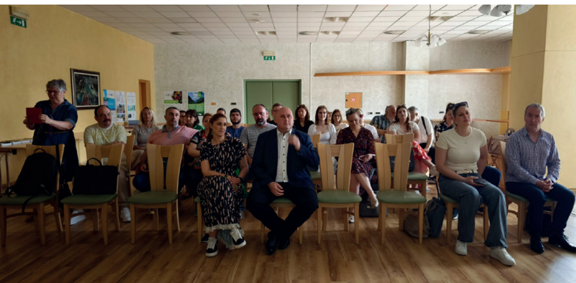
World Café »Digitalizacija in krožno gospodarstvo«, Terme Topolšica

Rezultat dela je ključna publikacija projekta, e-knjiga Rural Green: Best Practices and Policy Recommendations, ki združuje vpoglede iz vseh aktivnosti ter ponuja praktične pristope za uvajanje načel krožnega gospodarstva na podeželju. E-knjiga predstavlja preverjene prakse iz posameznih partnerskih držav in priporočila, oblikovana na podlagi skupnih razprav in terenskih izkušenj. Ne služi le kot povzetek projekta, temveč kot praktičen vir za skupnosti in institucije, ki želijo v svojih okoljih uvajati trajnostne in krožne rešitve.