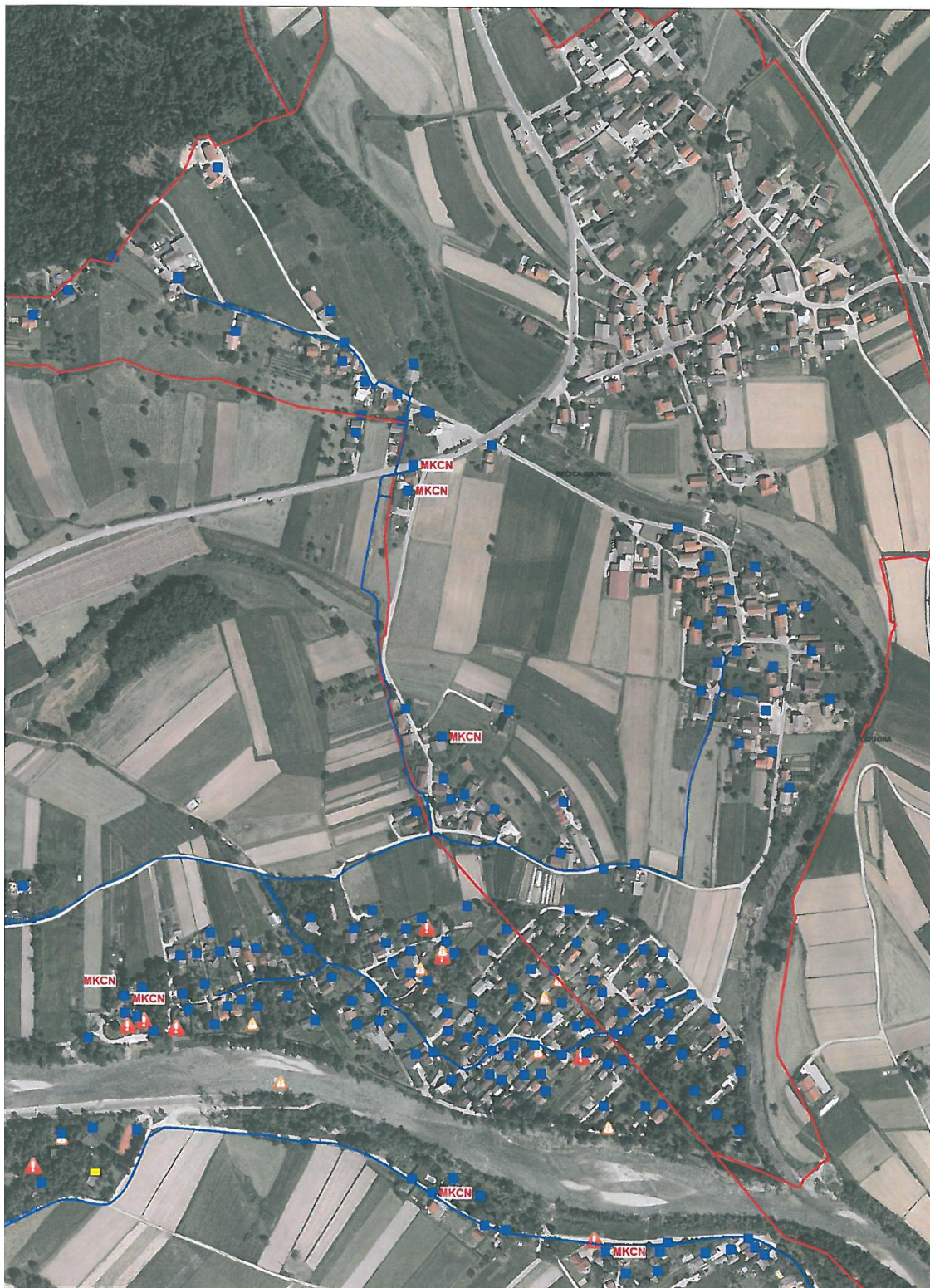
Območje javnega vodovoda Občine Šmartno ob Paki (Javno komunalno podjetje Žalec)