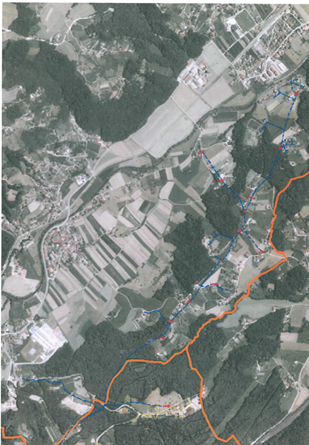
Območje javnega vodovoda Občine Šmartno ob Paki (Komunala Mozirje)